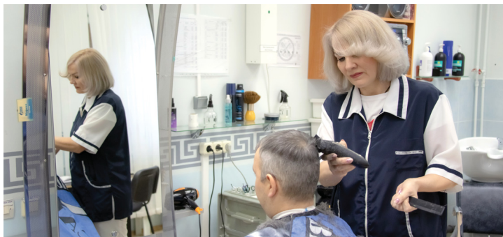
В парикмахерской Новозаполянского

С августа текущего года по решению комиссии по регулированию социально-трудовых отношений общества банно-прачечный цех управления по эксплуатации вахтовых посёлков предоставляет услуги по санитарно-гигиеническому обслуживанию в саунах и парикмахерских на безвозмездной основе.