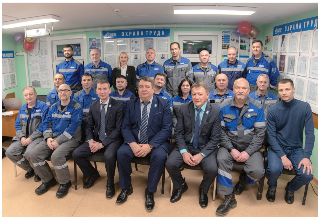
Коллектив МРУ и гости торжественного собрания