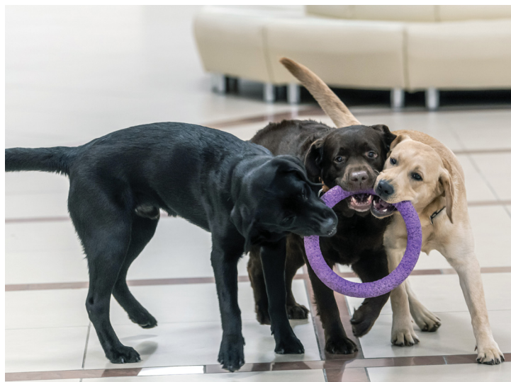
Им всё время хочется только бегать-веселиться. Но уже мгновенно реагируют на голос кинолога, бросая шуточные драки