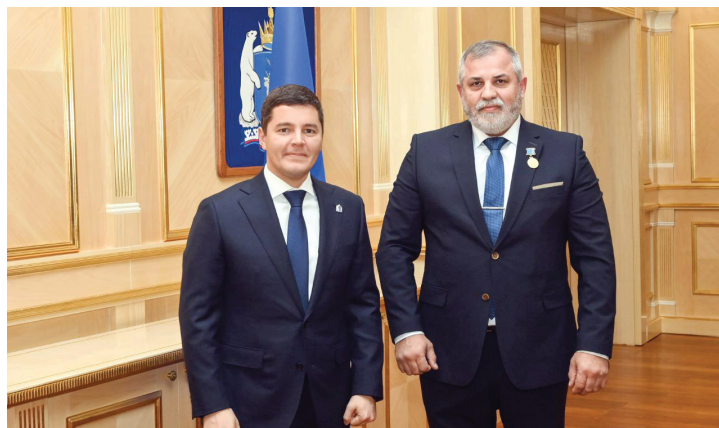
Фото Сергея ЧЕРКАШИНА ■