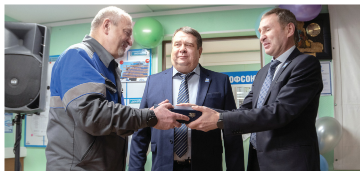
Вручение памятных подарков коллективу