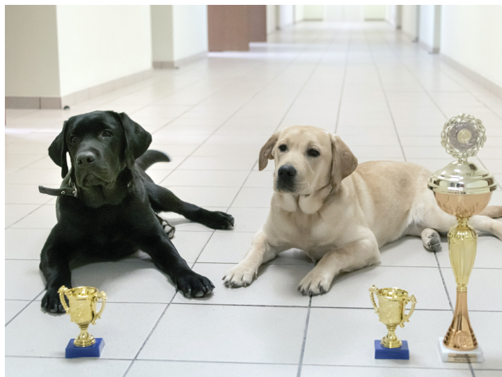
В октябре на выставке собак в Новом Уренгое они заняли три первых места