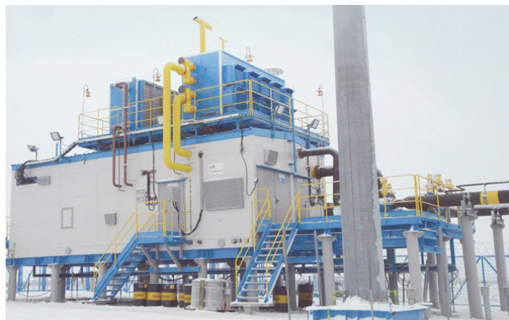
Сегодня на площадке куста газовых скважин № 510 модульную компрессорную установку готовят к опытно-промышленным испытаниям

Представители другой подрядной организации – ООО «Газстройпром-2» – ведут подключение объекта к линии электропередач на 10 кВ. Параллельно идёт также подключение силовых кабелей в высоковольтном отсеке МКУ.