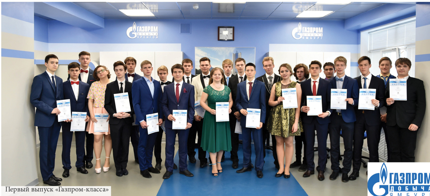
Первый выпуск «Газпром-класса»