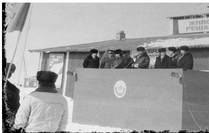
Митинг у клуба «Юность»