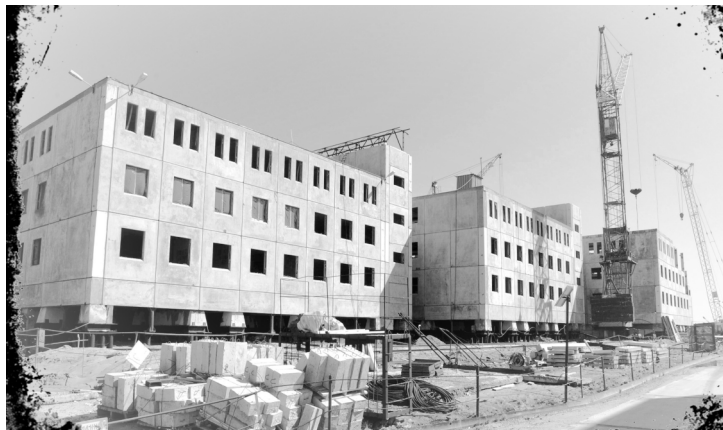
Идёт стройка административного инженерно-технического центра