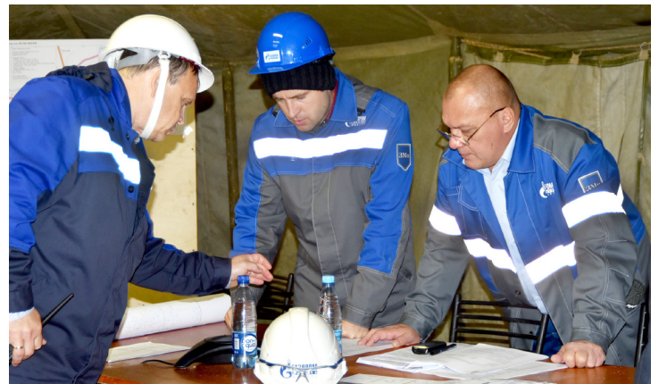
В штабе ликвидации аварии