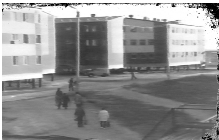
Идём от пятого модуля в шестому