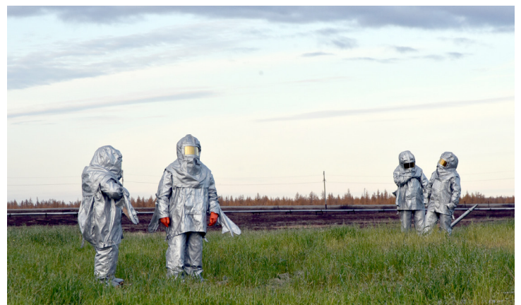
Теплоотражательные костюмы – надёжное средство защиты