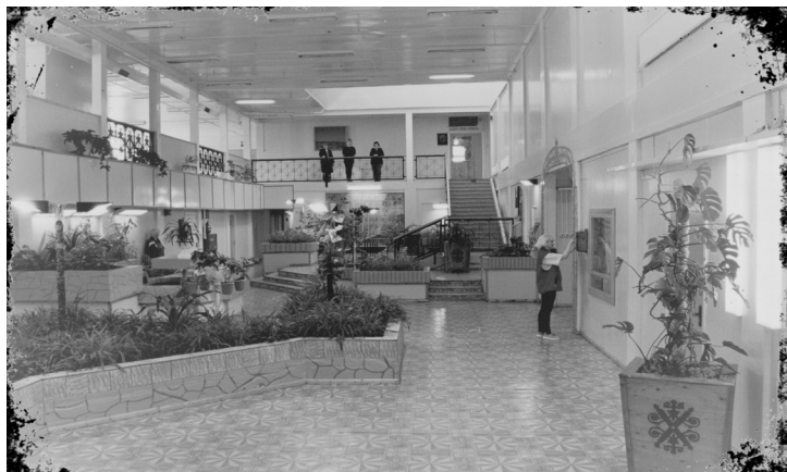
Холл шестого модуля