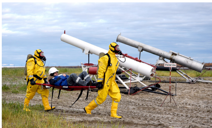
Эвакуация условно пострадавших