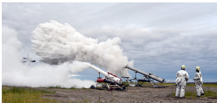
Кульминационный момент – выстрел из «пушек»