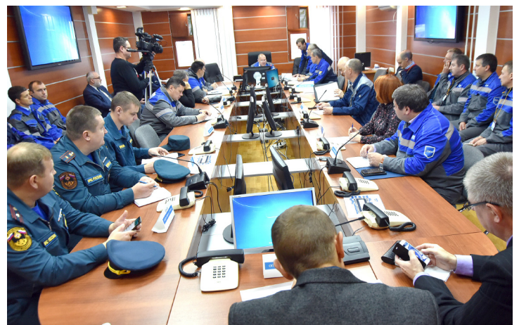
Пункт управления ТСУ в посёлке Ямбурге