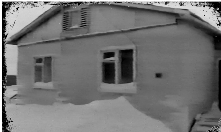
Под окнами коттеджа