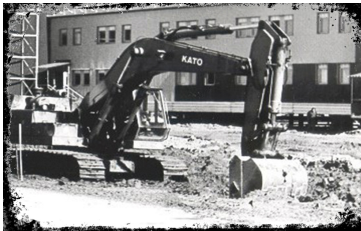
Обустраивается подъезд к стационару