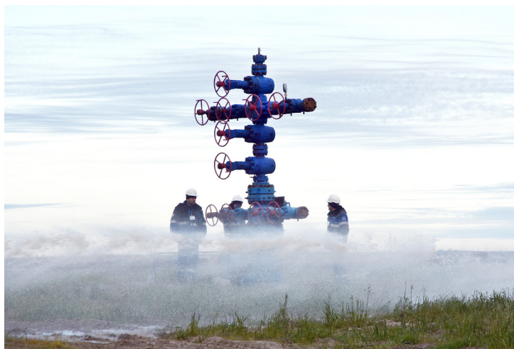
ТСУ проходили в условиях, максимально приближённых к реальным