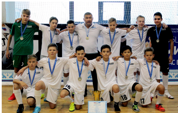
Футболисты 2006-2007 гг.р. – серебряные призёры первенства ЯНАО