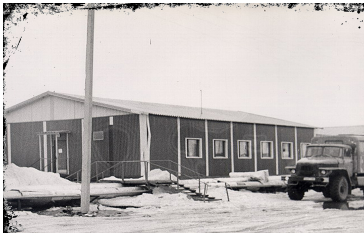
Если вам нужно в типографию, то и здесь пройдёт!