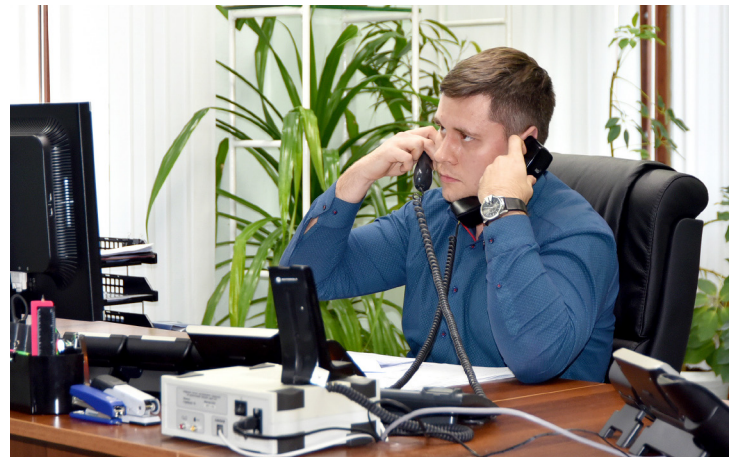
Идёт оповещение об аварии

В рамках практической части второго этапа отрабатывались действия членов КПЛЧСиОПБ, оперативной группы и взаимодействующих организаций непосредственно на месте (в аварийной, опасной зоне и зоне ЧС).