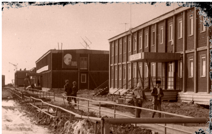
Тротуар вдоль зданий УЭВП и ЯРЭУ