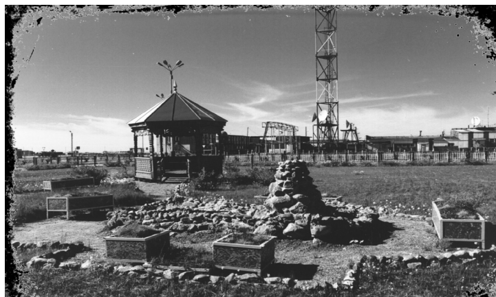
Так выглядела площадка перед гостиницей «Ямбург»