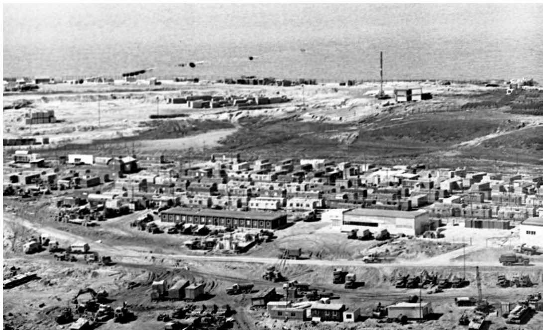
Вид на пионерный посёлок, 1986 год