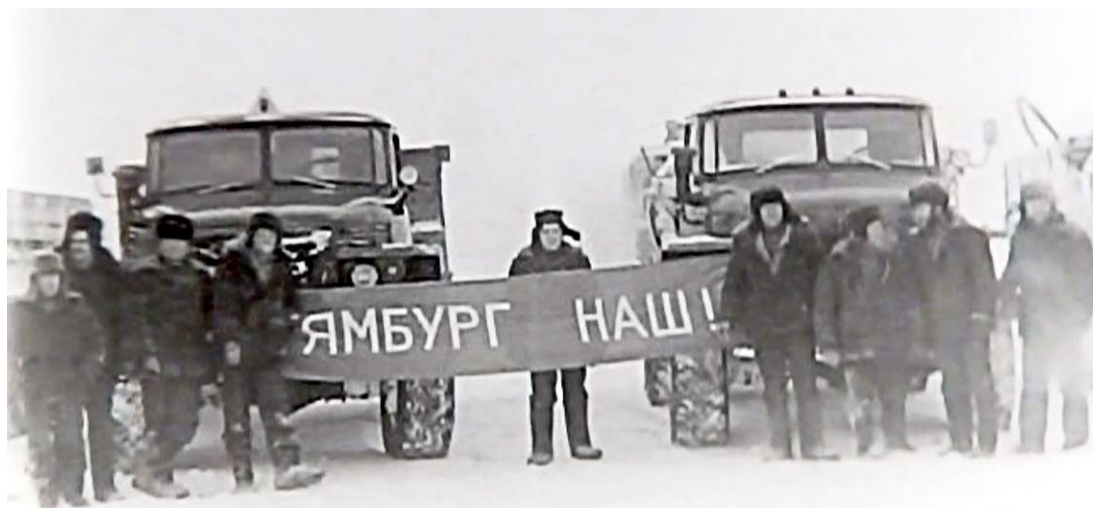
Торжественный митинг. Слова на транспаранте говорят сами за себя

«Вот тут один из водителей нажал на клаксон своего