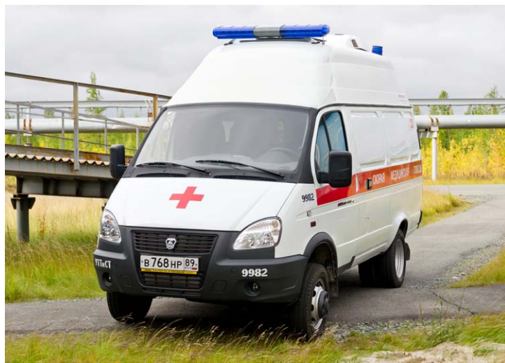
Машина прибыла в Новозаполярный из Нижнего Новгорода в сентябре