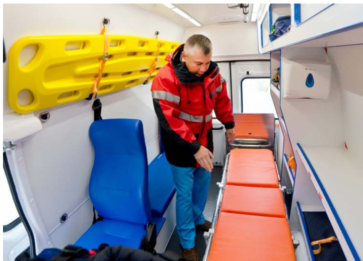
Внутри новой скорой просторно – можно стоять в полный рост