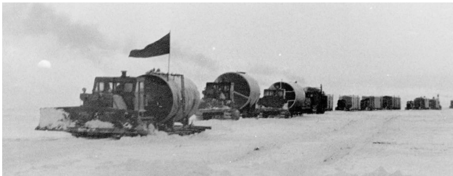
В санном поезде 1982 года было тридцать девять машин, в их числе тракторы с прицепами, гружённые бортовые «уралы» и бензовозы

Подготовила Светлана ЛЕБЕДЕВА ■