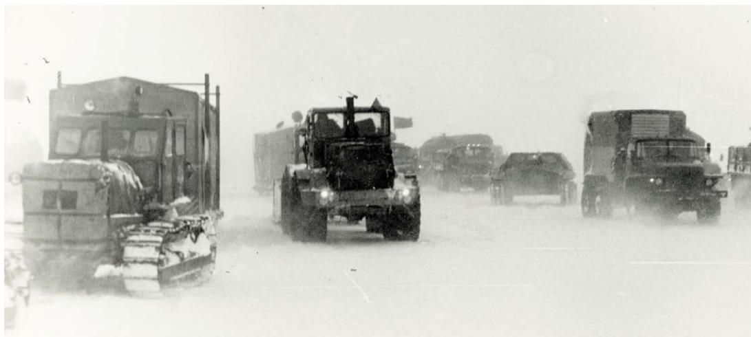
Первопроходцы перед стартом. Впереди почти 300-километровый переход с Медвежьего на Ямбург