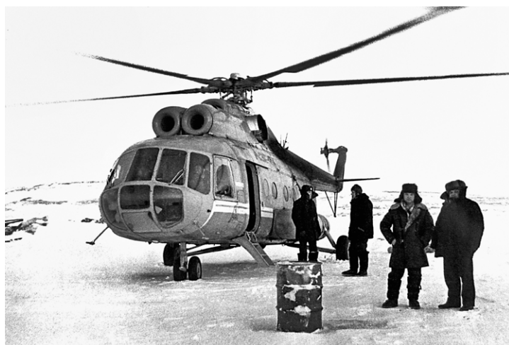
На таких вертолётах в то время летали на Ямбург

Гостиницей Ямбург обзавёлся не сразу, не до гостей, своих расселить трудно. Поэтому приезжие норвежцы завязать контакты с гидростроителями, самой гостеприимной здешней организацией – плавотрядом. В отрядном распоряжении имеется комфортабельное общежитие, по-морскому именуемое уродливым словом – «брандвахта», на которой несколько комнат отводится командированному люду. Плавучего статуса гостиницы весной не поймёшь, ибо брандвахта прочно впаяна в лёд крохотной тундровой речки с изуверски-трудным именем Нюдямонготоепокояха. Да и метель поработала столь мастерски, что сушу и лёд реки – не отличишь.