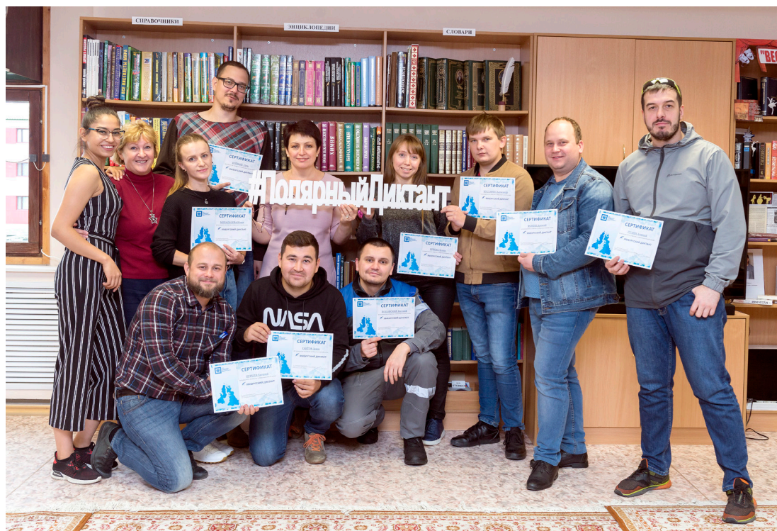
К «Полярному диктанту» готовы!