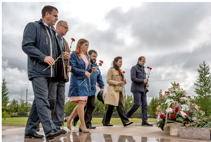
Возложение цветов к памятнику Александра Маргулова в Ямбурге

Диана МАКСИМОВА, Игорь ВЛАДИМИРОВ, Алексей РУСАНОВ