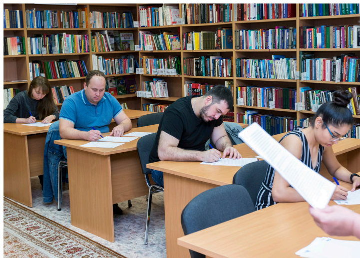
Диктант в самом разгаре