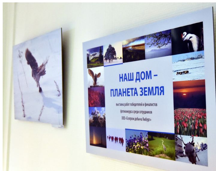
Выставка будет экспонироваться в ябургском КСК до октября

Игорь ВЛАДИМИРОВ ■