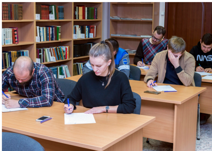
Семь раз подумай, а потом напиши...