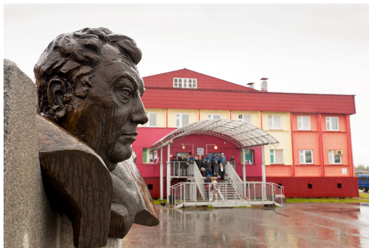
Бюст Андрея Бушуева рядом с вахтовым жилым комплексом ГП-2С