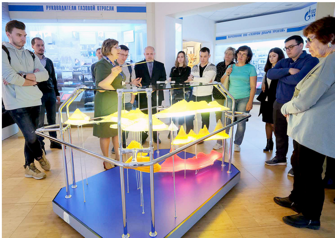
Экскурсия по музею ООО «Газпром добыча Уренгой»

В Новом Уренгое завершилась III Арктическая совместная научно-практическая конференция ООО «Газпром добыча Уренгой» и ООО «Газпром добыча Ямбург». С 28 мая по 1 июня в мероприятии приняли участие молодые учёные и специалисты – представители 27 дочерних предприятий ПАО «Газпром», других газодобывающих компаний и профильных высших учебных заведений. В этом году научный форум молодёжи был приурочен к 50-летию открытия Ямбургского нефтегазоконденсатного месторождения и 35-летию ООО «Газпром добыча Ямбург».