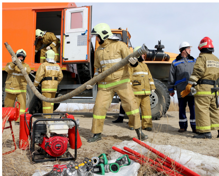
Дежурный караул ПСЧ № 27 выдвигается в район, определённый оперативной группой, для выполнения поставленных перед ними задач