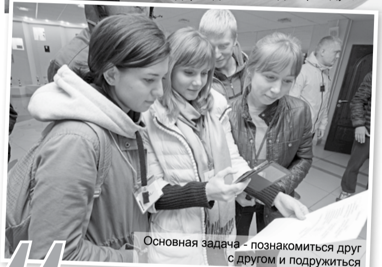
Основная задача - познакомиться друг с другом и подружиться

Чтобы найти ключ к решению каждой задачи, ребятам нужно было хорошо знать вахтовый посёлок и его историю: знаменательные события и даты, памятники и монументы, имена первопроходцев, названия улиц, рек и озёр в окрестностях и многое другое.