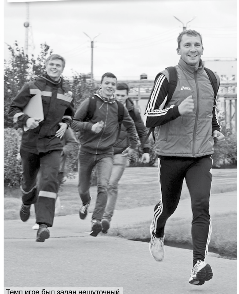
Темп игре был задан нешуточный