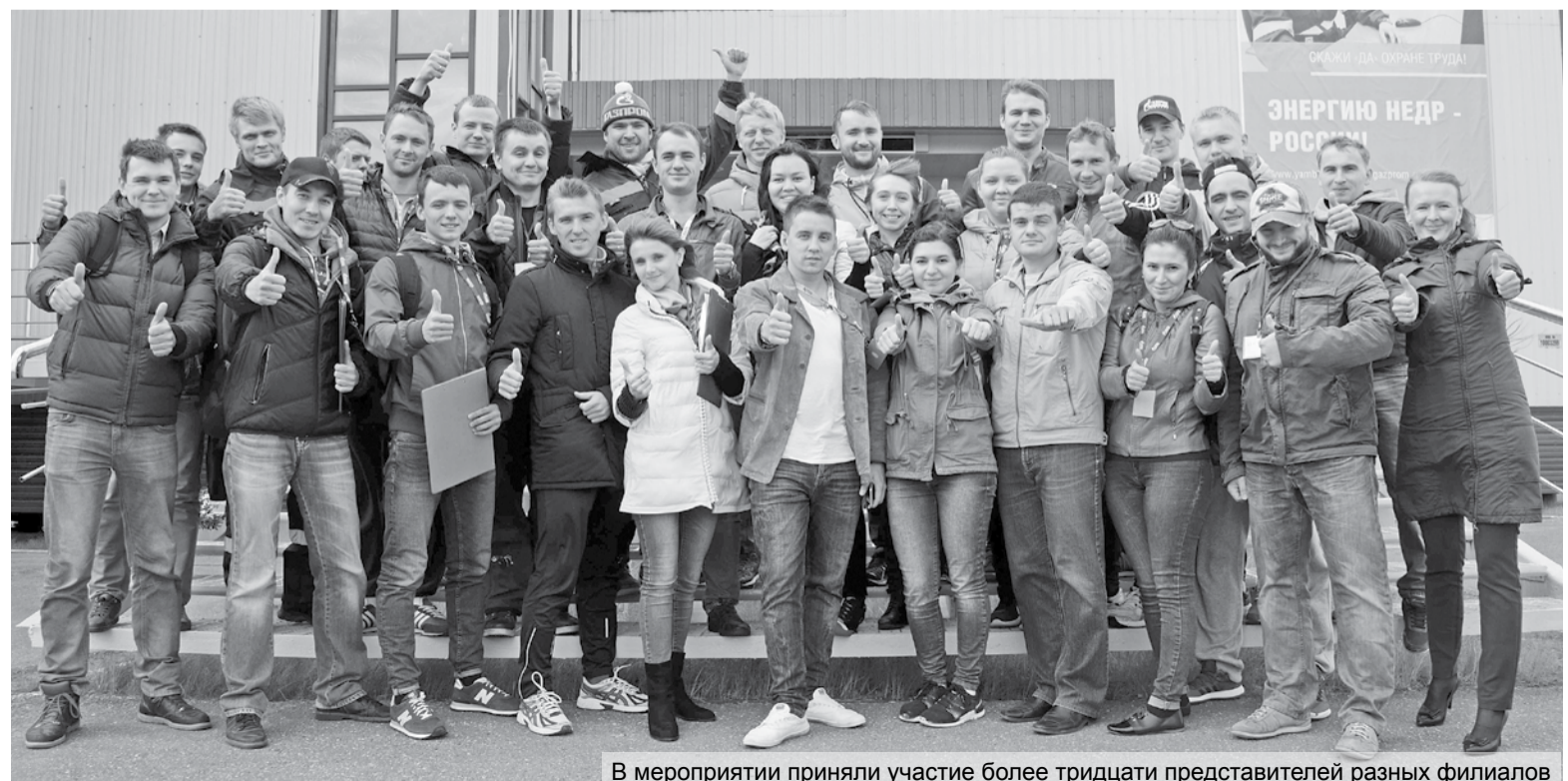
В мероприятии приняли участие более тридцати представителей разных филиалов